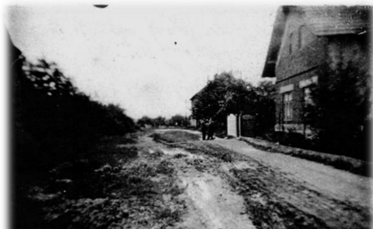
Foto z roku 1956. Habešská ulice před čp. 105. Je to vyfoceno před Menclovými před 60 lety. Byl jsem první, který tuto ulici zvětšil fotograficky. V pozadí je cesta k Dubu.